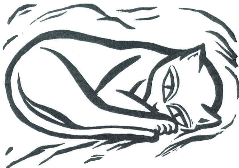
Georg Schrimpf: Kätzchen Holzschnitt auf Papier aus dem Nachlass von Erika Mitterer